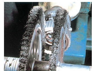
KORFIL-E:ギヤーのバリ取り