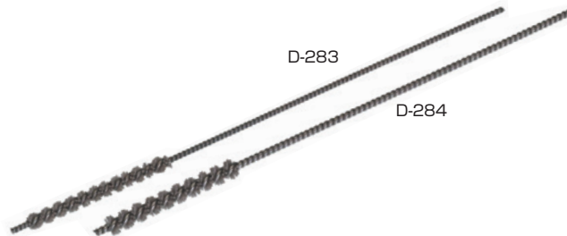
0.30 砥粒入ミニチュアブラシ(軸はSUS) (mm)