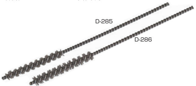
0.30 砥粒入ミニチュアブラシ(軸はSUS) (mm)