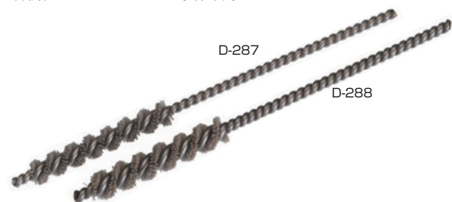
0.30 砥粒入ミニチュアブラシ(軸はSUS) (mm)