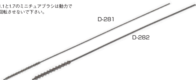
0.20 砥粒入ミニチュアブラシ(軸はSUS) (mm)