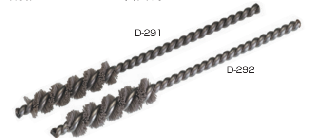
0.30 砥粒入ミニチュアブラシ(軸はSUS) (mm)